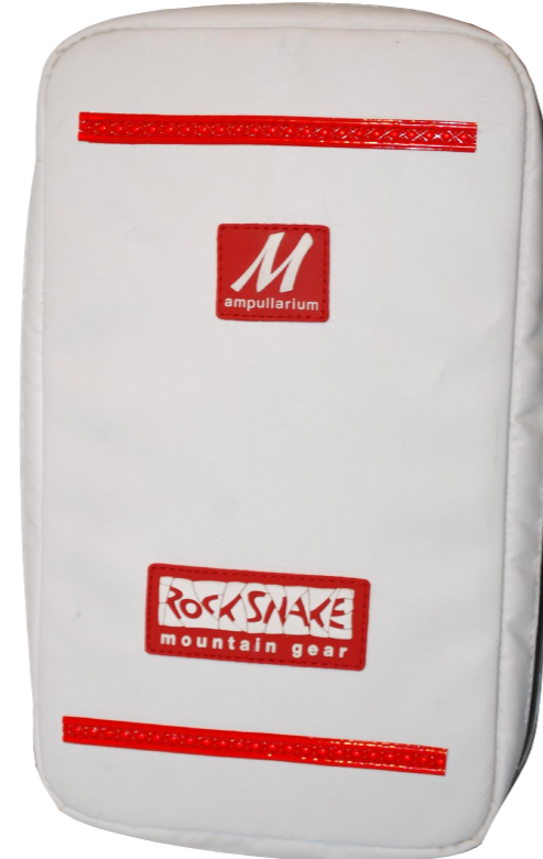
AOS M-line 3/3 - 2L oder 3L mit oder ohne separate Spritzenfächer:

Ampullenhalterungen: 2 ml schwarz 5 ml rot 10ml grau Flexibel, verstellbare Halterung