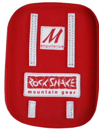
AOS M-line 1/3 - 1L oder 2L: