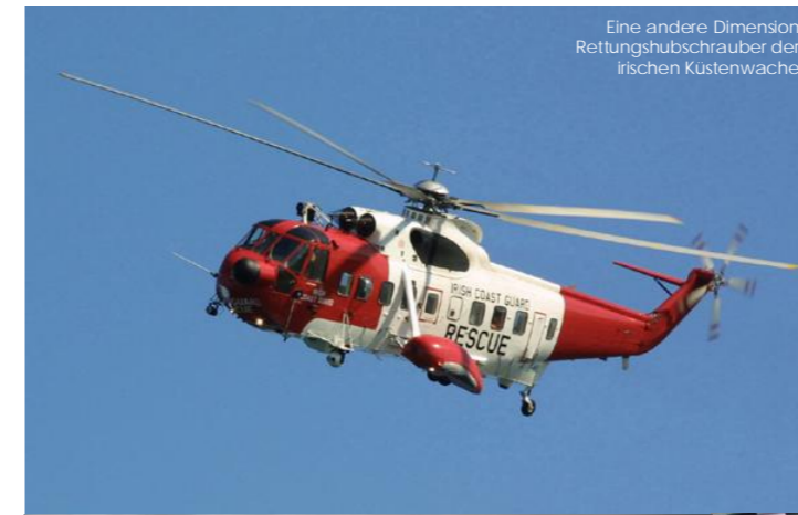
Eine andere Dimension Rettungshubschrauber der irischen Küstenwache