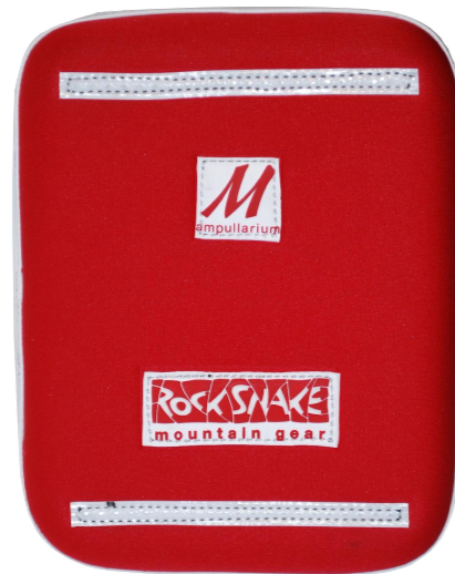
AOS M-line 2/3 - 2L oder 3L mit oder ohne separate Spritzenfächer: